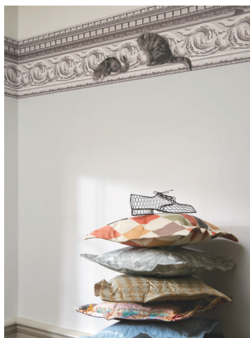
▲猫ちゃん柄もございます(輸入)

国内メーカーは、トリム高さ120mm前後が基本となっています。しかし輸入トリムは千差万別。巾(H)100mm程度のものから 400mmのBIGトリム も！無地壁紙と合わせるだけで、お部屋の雰囲気ガラリと変えることも可能です。